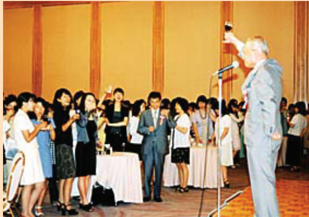
成田先生の乾杯(第2部)

今回は総会会場での先生方に突撃インタビュー！ こんなことおっしゃるのはどの先生でしょうか?!?!?!